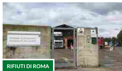
RIFIUTI DI ROMA

Sit in dei cittadini contro i Tir dell'Ama