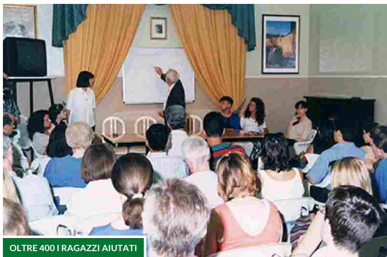
OLTRE 400 I RAGAZZI AIUTATI

ISTRUZIONE Quasi un ragazzo su tre in Lombardia non arriva al diploma. È uno dei dati emersi ieri a Palazzo Marino al convegno "Scuole della Seconda Opportunità - radici e germogli a Milano", promosso dalla Fondazione Sicomoro, Ordine dei Barnabiti e Caritas Ambrosiana. Nella graduatoria di successo scolastico la regione più virtuosa è l'Umbria con un tasso di dispersione del 18,2%, mentre le performance peggiori si registrano in Sardegna (36,2%), Sicilia (35,2%) e Campania (31,6%). In Lombardia si sfiora il 30%, con quasi uno studente su tre che non riesce a conseguire il diploma. Altro dato indicativo: il 45% di chi possiede solo la licenza media resta senza occupazione. Ragazzi che finiscono nel bacino dei Neet, quei giovani tra i 15 e i 29 anni che non studiano, non lavorano né si formano per trovarlo. "Per contrastare questo fenomeno - spiegano i promotori - occorre intervenire negli anni della scuola dell'obbligo, nella fascia di età tra i 14 e i 16 anni, periodo nel quale i ragazzi che rischiano di abbandonare gli studi sono il 49,8%". E proprio su ragazzi di queste fasce di età (pluriripetenti, migranti, inadempienti, privi del titolo di licenza media) operano le Scuole della Seconda Opportunità, attive